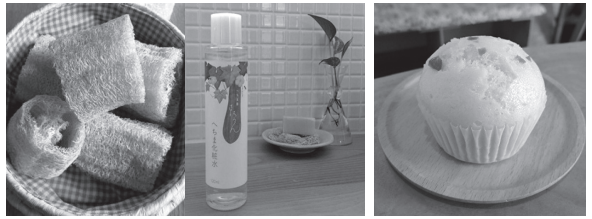
へちまたわし、へちま化粧水【へちま屋さはらん】