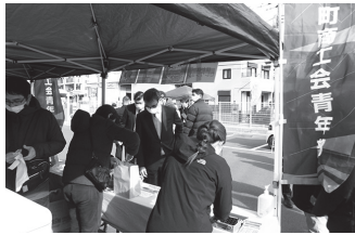
以前の出店参加の様子

午前9時30分～午後3時まで販売していますので、ぜひ遊びに来てください。なお、売り切れ次第販売終了となりますので、お早めにお越しください。