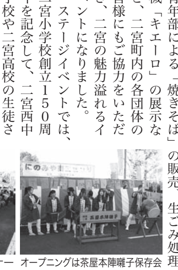
オープニングは茶屋本陣囃子保存会

ステージイベントでは、二宮小学校創立150周年を記念して、二宮中学校や二宮高校の生徒さんによるダンス、うらら合唱団による合唱などを披露し、会場は熱気に包まれました。 ご協力いただいた皆様に改めて感謝を申し上げます。