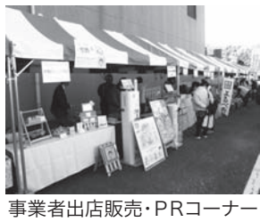
事業者出店販売・PRコーナー