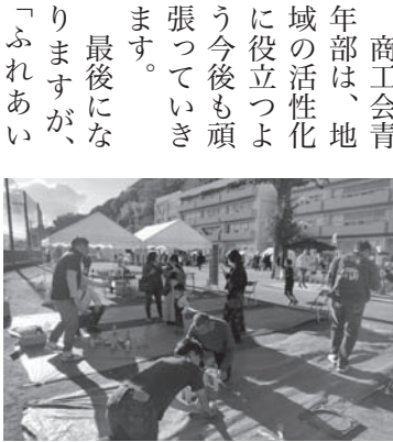
モルックコーナー

当日は朝方まで雨が降っていましたが、開催時間の10時には雨は上がりイベント日和となり、大勢の方にご来場いただくことができました。