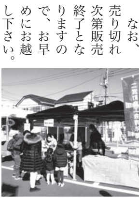
以前の出店参加の様子

当日は、部員の事業所である「たこやき屋Cota」のたこやき、「だいちや」の蒸しパンを販売する予定です。午前9時30分〜午後3時まで販売していますので、ぜひ遊びにきて下さい。