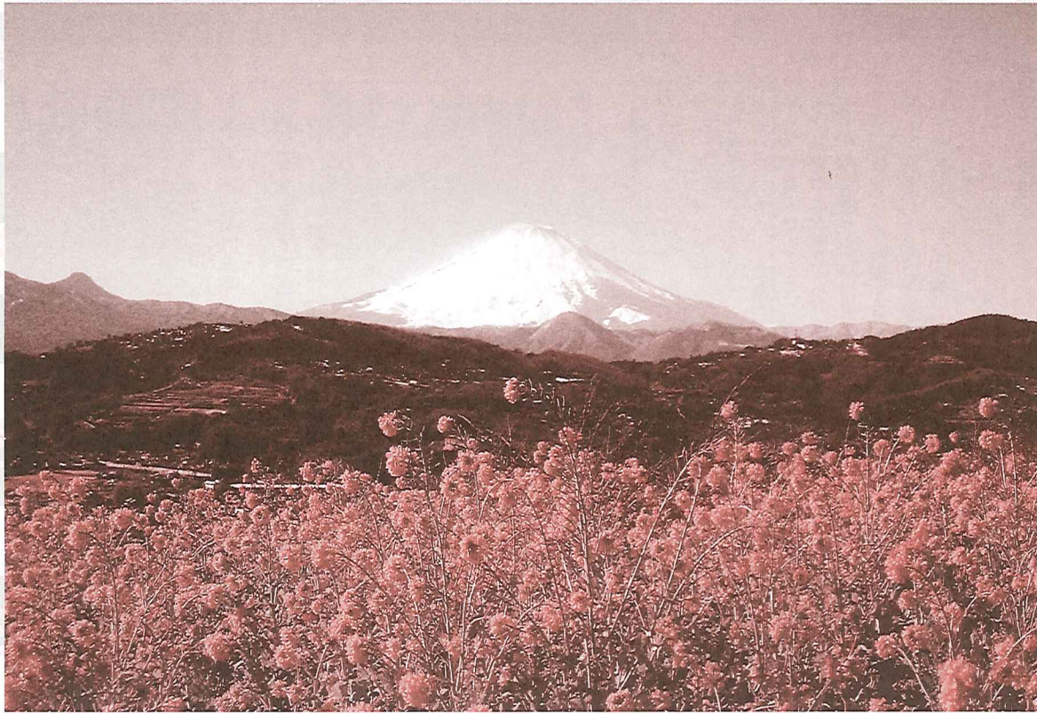
早春の吾妻山山頂からの富士山と菜の花