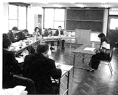
ヒアリング審査の様子

セミナー終了後、9月3日から28日までビジネスプランの募集を行い本年は11件の申込がありました。コーディネーターによる書類選考、運営委員会の議を経て6名の方にヒアリング審査を実施し、11月16日起業家支援事業認定委員会が開催され下記の2名が認定者として選定されました。