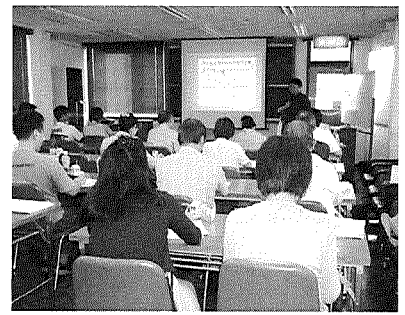
起業家セミナーでの一コマ

続いて研修会を開催し併せて当事業にかかる啓発等を行いました。セミナーについては「実践起業家ゼミナール」と銘打ち、全五回にわたる構成にて開催しました。セミナー全五回の出席総数は一五四名となり一回の平均受講者数は三〇・四名にて昨年度の平均受講者数一七・一名を大幅に上回る結果となりました