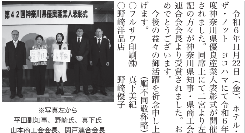
令和6年11月22日(金)、ホテル・ザ・ノット ヨコハマにて令和6年度神奈川県優良産業人表彰式が開催されました。同席上にて二宮より左記の方々を神奈川県知事・県商工会連合会会長より受賞されました。おめでとうございます。