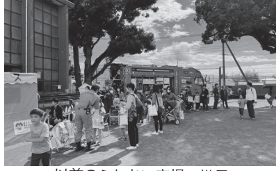
以前のふれあい広場の様子

また、日頃より青年部の活動にご理解とご協力を賜り、心より感謝申し上げます。今後とも引き続き、皆様の温か