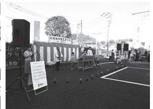
オープニングは越地祭囃子保存会