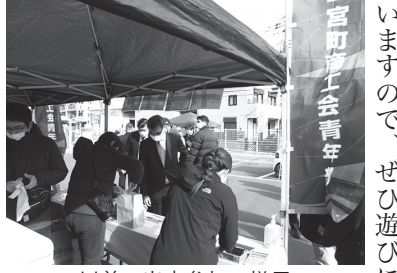
以前の出店参加の様子

いご支援をいただけますと幸いです。どうぞよろしくご厚意申し上げます。 菜の花ウオッチング出店参加予定 令和7年1月11日(土) からGSパーク二宮駅前駐車場にて「菜の花ウオッチング特産品販売会」が開催されていますが、商工会青年部では1月25日(土)に出店参加します。 当日は青年部ほかほかセレクトショと題しまして、部員の事業所である「だいちや」の蒸しパン、新入部員の出店し、たい焼などを販売する予定です。午前9時30分～午後3時まで販売していますので、ぜひ遊びに来てください。 お、売り切れ次第販売終了となりますので、お早めにお越しください。