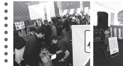
出店ブースの様子