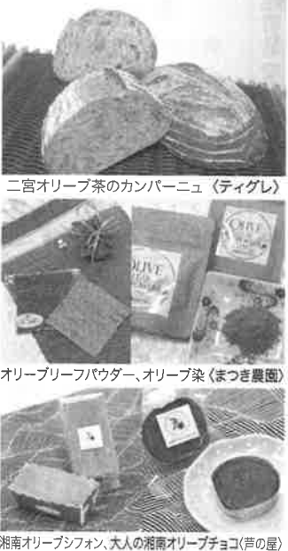
二宮オリーブ茶のカンパーニュ(ティグレ) オリーブリーフパウダー、オリーブ染(まつぎ農園) 湘南オリーブシフォン、大人の湘南オリーブチョコ(声の星)

二宮ブランド推進協議会では、平成30年10月に二宮ブランド認定審査会を実施し次の商品が新たに認定商品となりました。