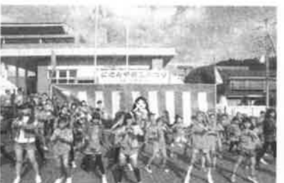
おとちゃんオリジナルダンス披露