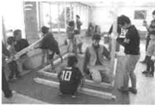
ふれあい広場～大工体験の1コマ

今回は、町民センター・武道館・役場駐車場を使用して、ドッグトレーナー体験やパティシエ体験、大工体験、マジシャン体験、テニス体験、消防士体験、警察体験などワクワクドキドキの職業体験を行いました。また、「にのみやLOVERS」の皆様にもご協力をいただき、楽しい塗り絵コーナーを催していただきました。そして、商工会青年部OBや商工会女性部の皆様にもご協力をいただき、模擬店を出していただきました。当日はお天気にも恵まれ、たくさんの方々が参加してくださいました。