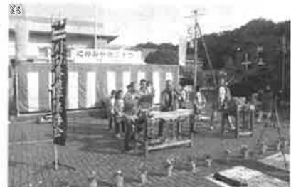
オープニングは川勾祭囃子保存会

今回は、二宮のオリーブを使ったオリーブスイーツの試食とアンケートやオリーブ足湯、そして、二宮町商工会キョラクター「おとちゃん」のイメージソング「愛LOVEにのみや」や「妻山物語」の新曲発表やジャギーキッズの皆様のご協力をいただき、「おとちゃん」イメージソングに合わせた「おとちゃん」オリジナルダンスを披露しました。そして、昨年に新発売した「おとちゃんバーガー」も7店舗による販売を行いました。人気のうちに完売することができました。また、ステイジイベントでは、祭囃子やキッズダンス、フラダンス、軽音楽、OLAアイドルグループのコンサート、ジャンケン大会などが催され、会場は熱気に包まれ無事終了することができました。「にのみや商工まつり」にご協力いただいた皆様に改めて感謝を申し上げます。